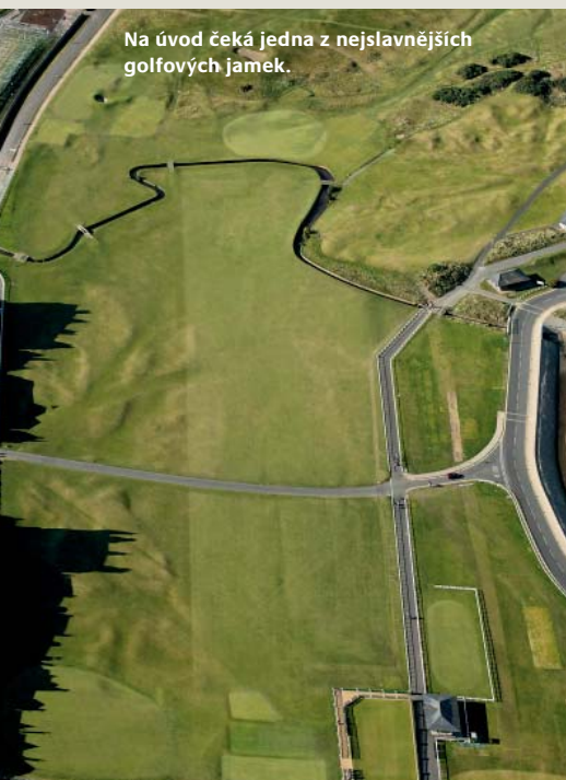
Na úvod čeká jedna z nejslavnějších golfových jamek.

Jamka kříže. Pro její název se nabízejí dvě vysvětlení. Jedno říká, že hráči museli cestou ke grínu přejít (to cross) malou rozsedlinu, druhé se jednoduše přiklání k teorii, že zde kdysi stával kříž. Hráči by měli pálit vlevo od dvou vzdálených bankrů nazývaných The Spectacles (Brýle). Zároveň by si však měli dát pozor na další skupinu bankrů The Baerries, pojmenovanou podle toho, že tráva, jež je pokrývá, připomíná plnovous.