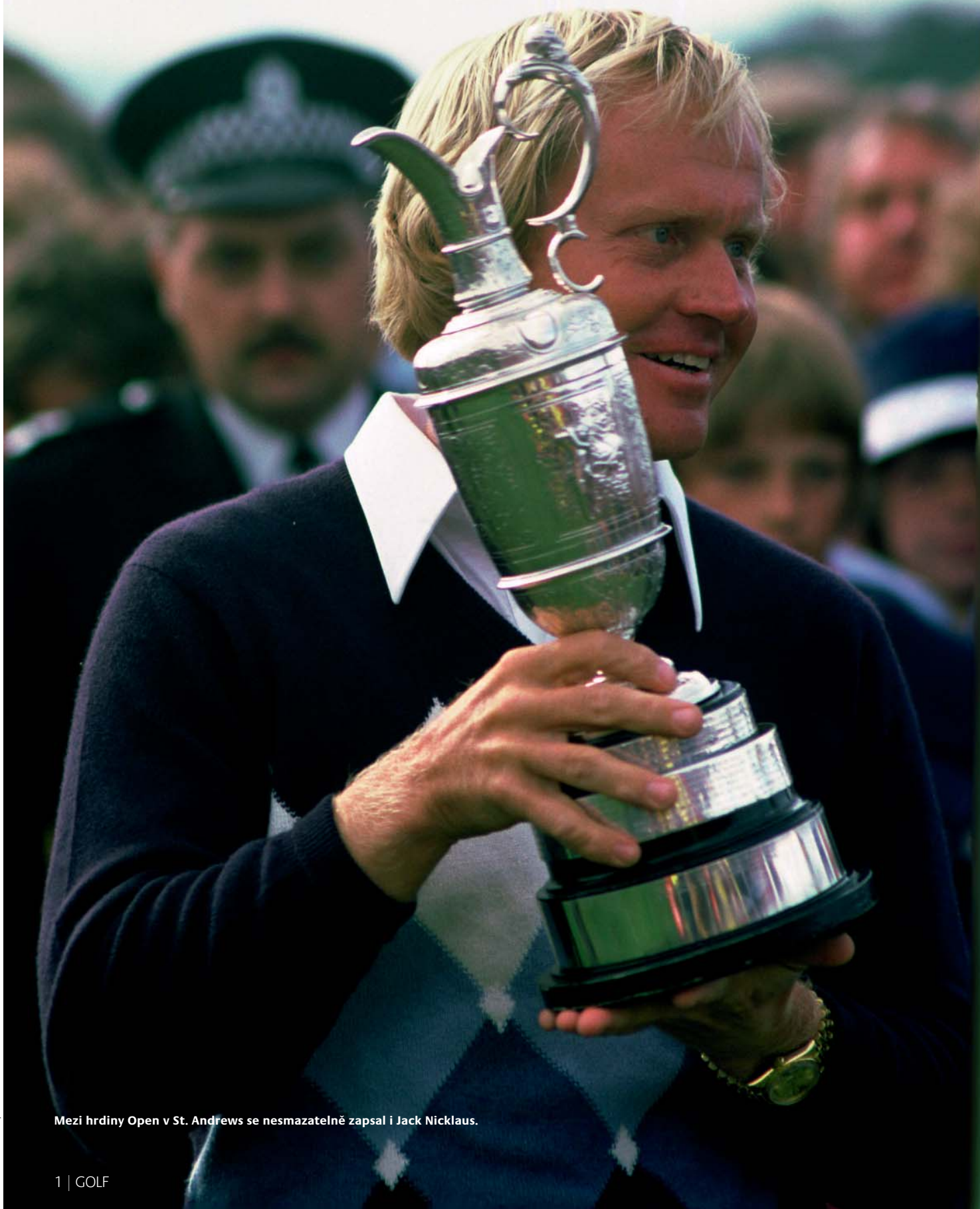
Mezi hrdiny Open v St. Andrews se nesmazatelně zapsal i Jack Nicklaus.