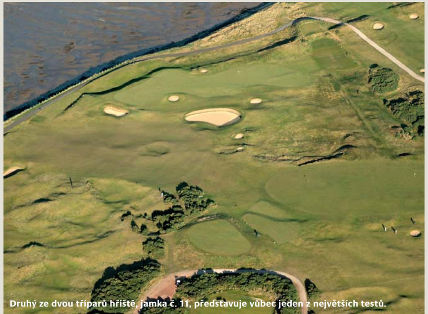
Druhý ze dvou tříparů hřiště, jamka č. 11, představuje vůbec jeden z největších testů.

Golfisté hrající z mistrovských odpališť se na této jamce musí spolehnout na marker, který jim ukazuje, jak svou ránu umístit co nejvýhodněji. Z bližších odpališť je třeba se snažit zacílit vlevo a vyhnout se bankrům po obou stranách ferveje. Před grínem ještě číhá zrádná prohlubeň.