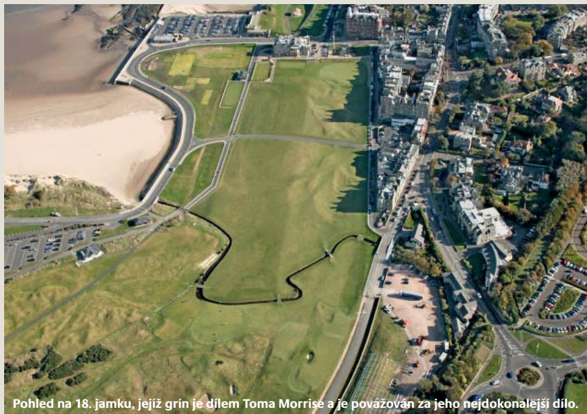
Pohled na 18. jamku, jejíž grín je dílem Toma Morrise a je považován za jeho nejdokonalejší dílo.