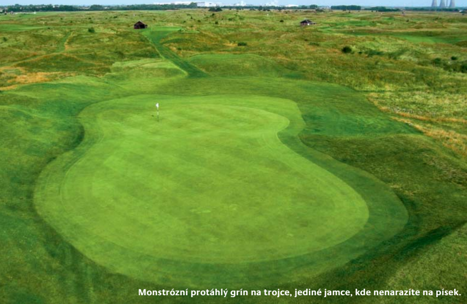
Monstrózní protáhlý grín na trojce, jediné jamce, kde nenarazíte na písek.