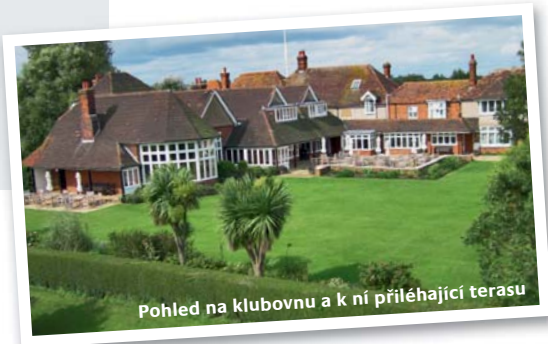
Pohled na klubovnu a k ní přiléhající terasu

nyní měří 496 yardů a jeho poznávacím znamením jsou dva obrovské bankry „zdobící“