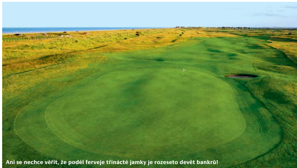
Ani se nechce věřit, že podél ferveje třinácté jamky je rozseto devět bankrů!

a 15 vznikla nová odpaliště. Ta hřiště nejen prodloužila, ale zároveň mírně změnila úhel hry některých jamek. Například odpaliště devítky (par 4, 410 yardů) posunuli dozadu a doleva, takže vytvořili ještě výraznější dog-leg. Některé z fervejí získaly nové kontury, na několika jamkách „umírnili“ raf.