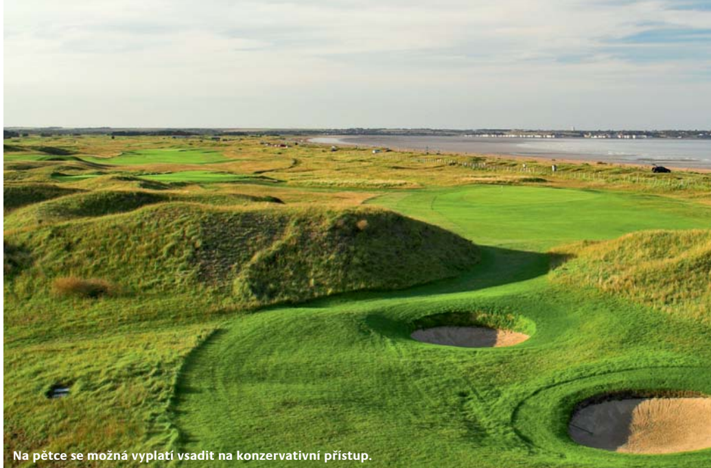
Na pětce se možná vyplatí vsadit na konzervativní přístup.

svah duny, tyčící se 235 yardů před odpalištěm. V roce 2003 v jednom z nich uvízl Australan Mike Harwood a bitva o vysvobození míčku ho stála minimálně dvě rány.