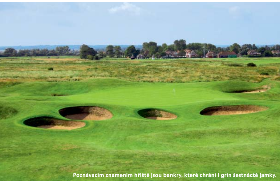
Poznávacím znamením hřiště jsou bankry, které chrání i grín šestnácté jamky.

Největší změnou prošla patrně osmnáctka, kde bylo snahou více odměnit přesnost. Fervej na pravé straně rozšířili tak, aby poskytovala prostornější místo pro dopad míčku, a přidali i dva nové bankry, které mají povzbuzovat hráče, aby pálili doprava. Nicméně hra z pravé strany je výrazně obtížnější, neboť pravou přední stranu grínu chrání bankr.