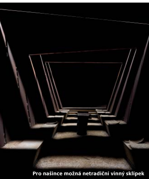
Pro našince možná netradiční vinny sklípek

prostorné ferveje, dále jezera a strategicky umístěné bankry.