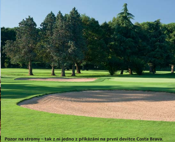
Pozor na stromy – tak z ní jedno z příkázání na první devítce Costa Brava.