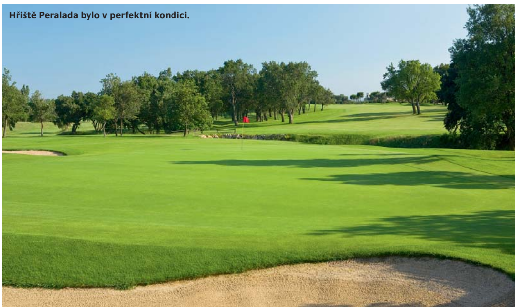
Hřiště Peralada bylo v perfektní kondici.

Platja de Pals se nachází uprostřed piniového háje nedaleko od pláže. Zdejší borovice působí jako veliké deštníky či houby a vytváří dojem neproniknutelné přírodní střechy. Hřiště je charakteristické