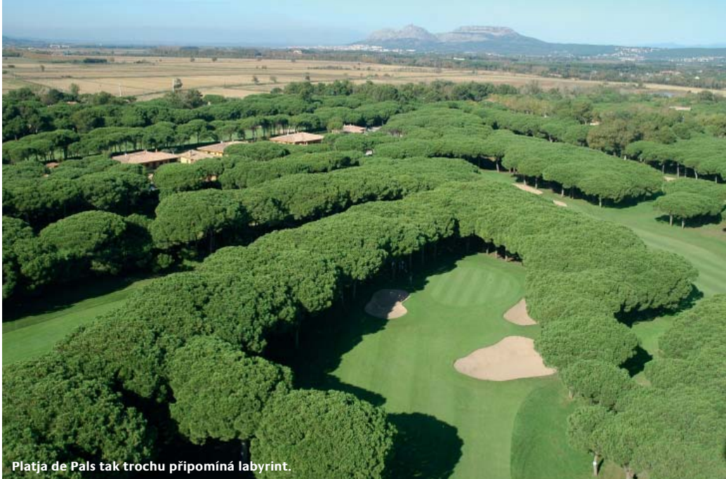
Platja de Pals tak trochu připomíná labyrint.

Tour Course je kratší a o něco snazší než Stadium Course, ale designéři Ángel Gallardo a Neil Coles se postarali, aby hřiště zůstalo opravdovou výzvou pro hráče všech úrovní. Jeho dominantou jsou vysoké borovice, které lemují široké,