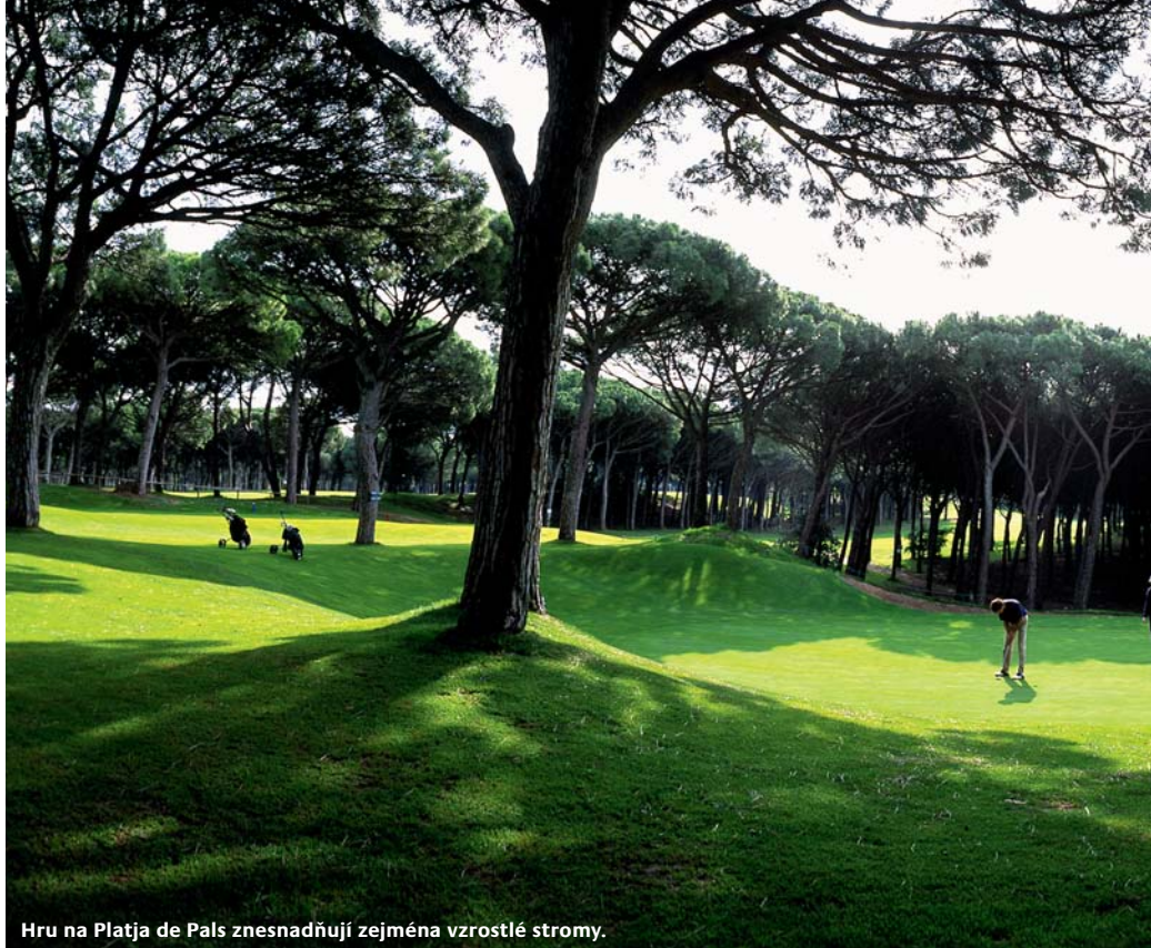
Hru na Platja de Pals znesnadňují zejména vzrostlé stromy.

Green fee – vedlejší sezona: 60 € (po–pá) | 76 € (so–ne)