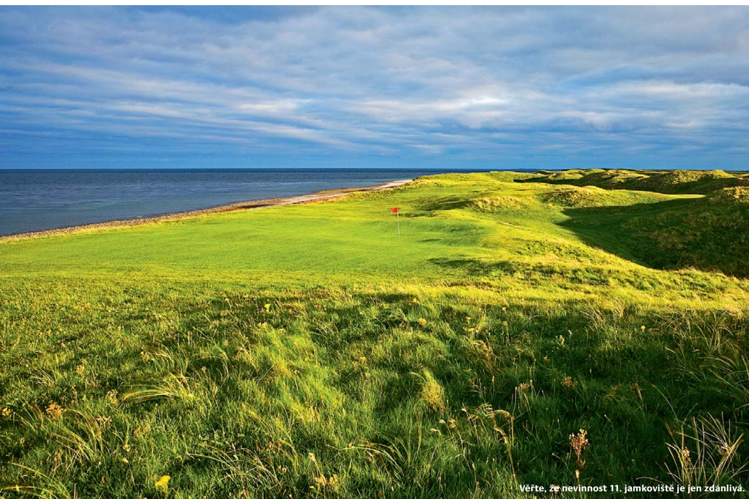
Věřte, že nevinnost 11. jamkoviště je jen zdánlivá.