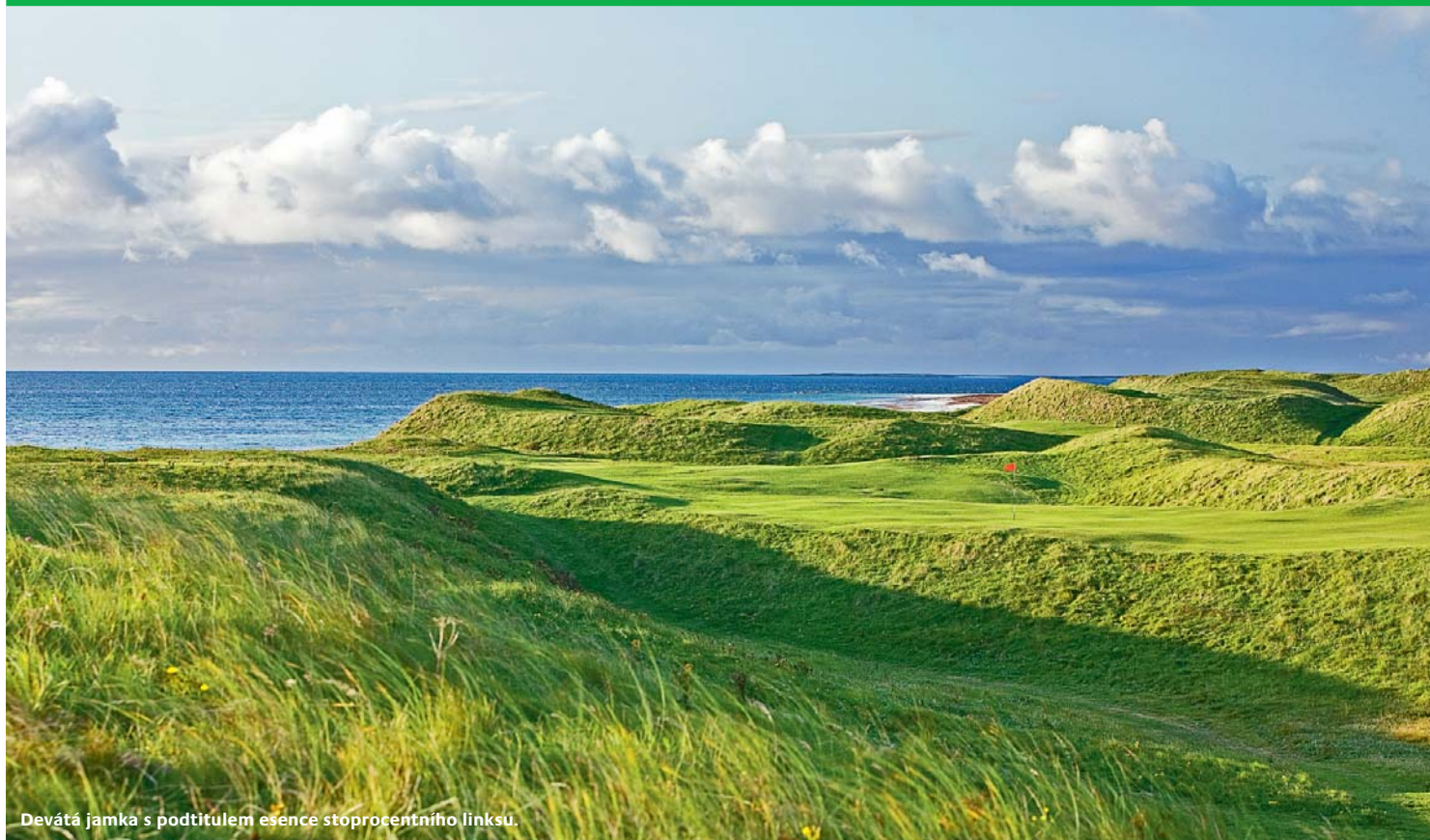
Devátá jamka s podtitulem esence stoprocentního linksu.