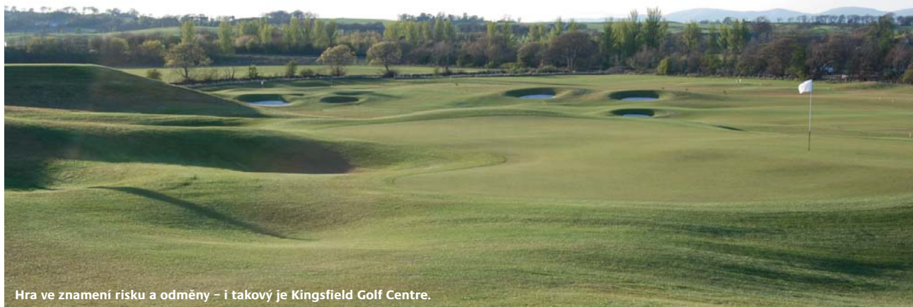
Hra ve znamení risku a odměny – i takový je Kingsfield Golf Centre.

si kladou za cíl vylepšit každý aspekt vaší hry. V každé skupině mohou být pouze čtyři hráči, aby bylo zaručeno, že se každému z nich dostane adekvátní míry pozornosti a zároveň cena zůstane díky skupinové výuce příznivá.