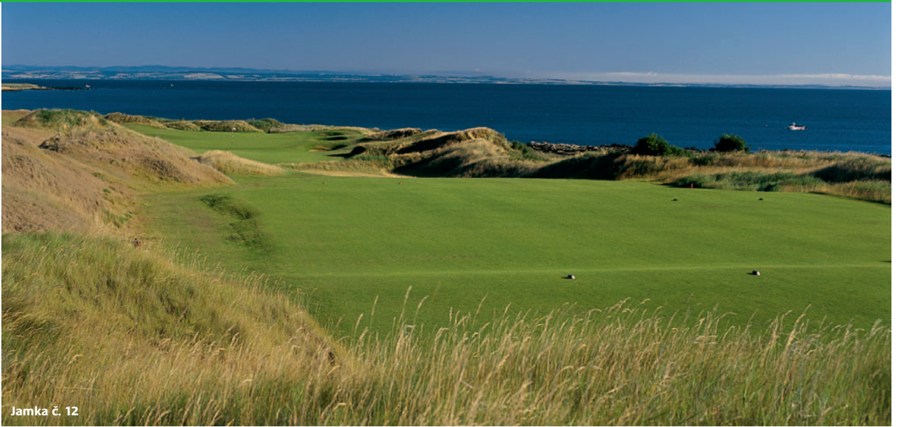
Jamka č. 12

To se jim podařilo dokonale. Jen těžko uvěříte, že tento kus země nenese svou podobu už několik století. Výhledy na vzdálené Carnoustie, Muirfield nebo Crail Balcomie vás nutí uvěřit, že Kingsbarns je stejně staré jako tyto historické golfové klenoty.