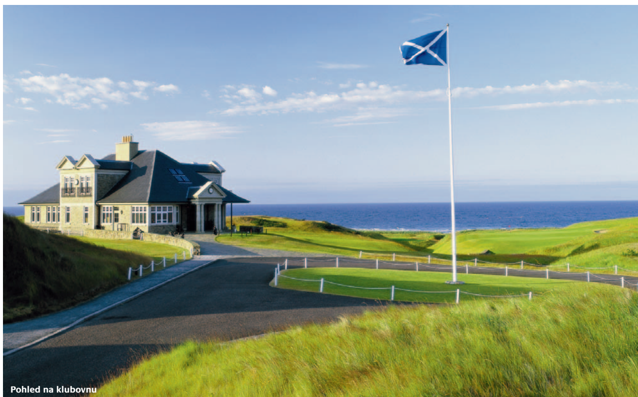
Pohled na klubovnu

Při výstavbě bylo přemístěno celých 300 000 kubických yardů zeminy, což dalo vzniknout bankrům, dunám a náročným, zvládnutelným fervejím. Philips a Parsinan se nechali inspirovat hřištěm Royal Dornoch u Aberdeenu s cílem vybudovat Kingsbarns jako hřiště, které působí jako přírodní útvar spíše než jako umělá konstrukce.