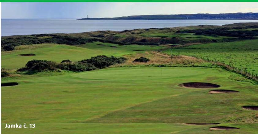
Jamka č. 13

Možná si myslíte, že na tříparových jamkách si od stresu trochu odpočinete, ale není tomu tak. Buď tříparovky hrát umíte a pak jste první ranou na grínu, nebo