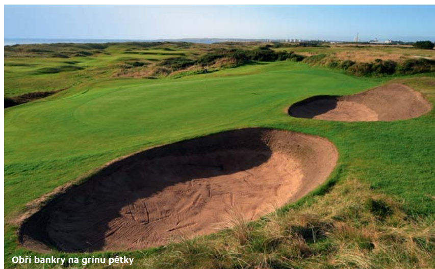
Obří bankry na grínu pětky

Fee: duben až říjen: 70 £/kolo 95 £/den (po-pá) / 90 £/kolo (so-ne)