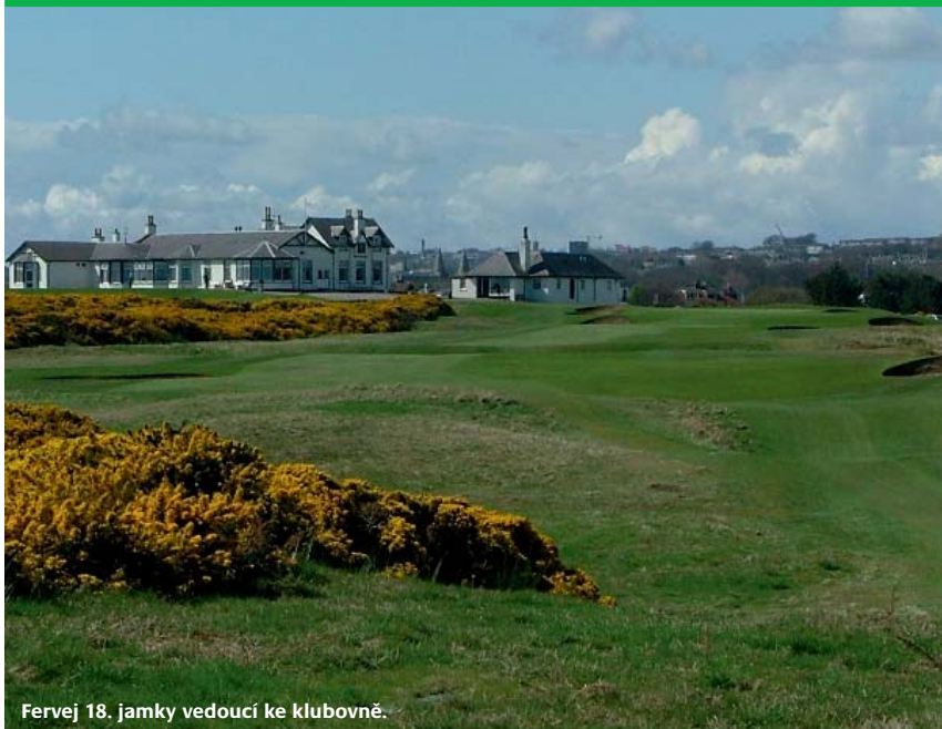
Fervej 18. jamky vedoucí ke klubovně.

k vám na straně jedné a směrem k pláži na straně druhé.