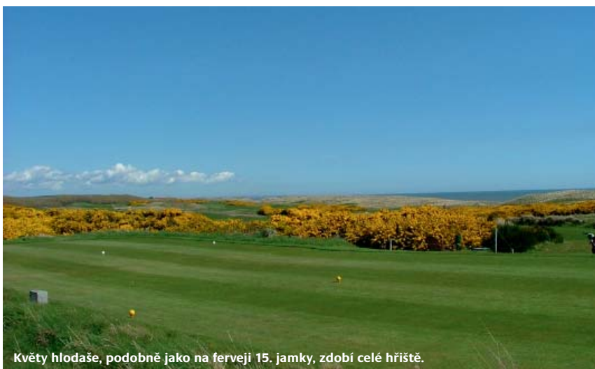
Květy hlodaše, podobně jako na ferveji 15. jamky, zdobí celé hřiště.

Odměnou po dokončení kole golfu ať už v jakýchkoliv povětrnostních podmínkách vám bude velice tradičně zařízená klubovna dýchající atmosférou a obklopující vás všudypřítomnými golfovými proprietami. A cena za tento jedinečný zážitek? V hlavní sezoně zaplatíte 100 £ ve všední den a 120 £ o víkendu. ■