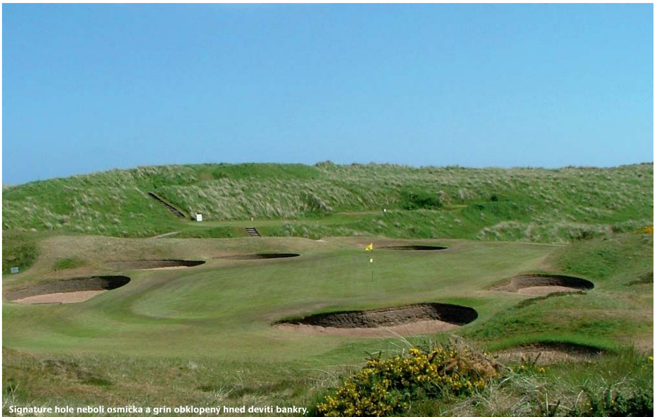
Signature hole neboli osmička a grín obklopený hned devíti bankry.

Fee: duben, říjen: 75 £/kolo | leden až březen: 50% z letní ceny