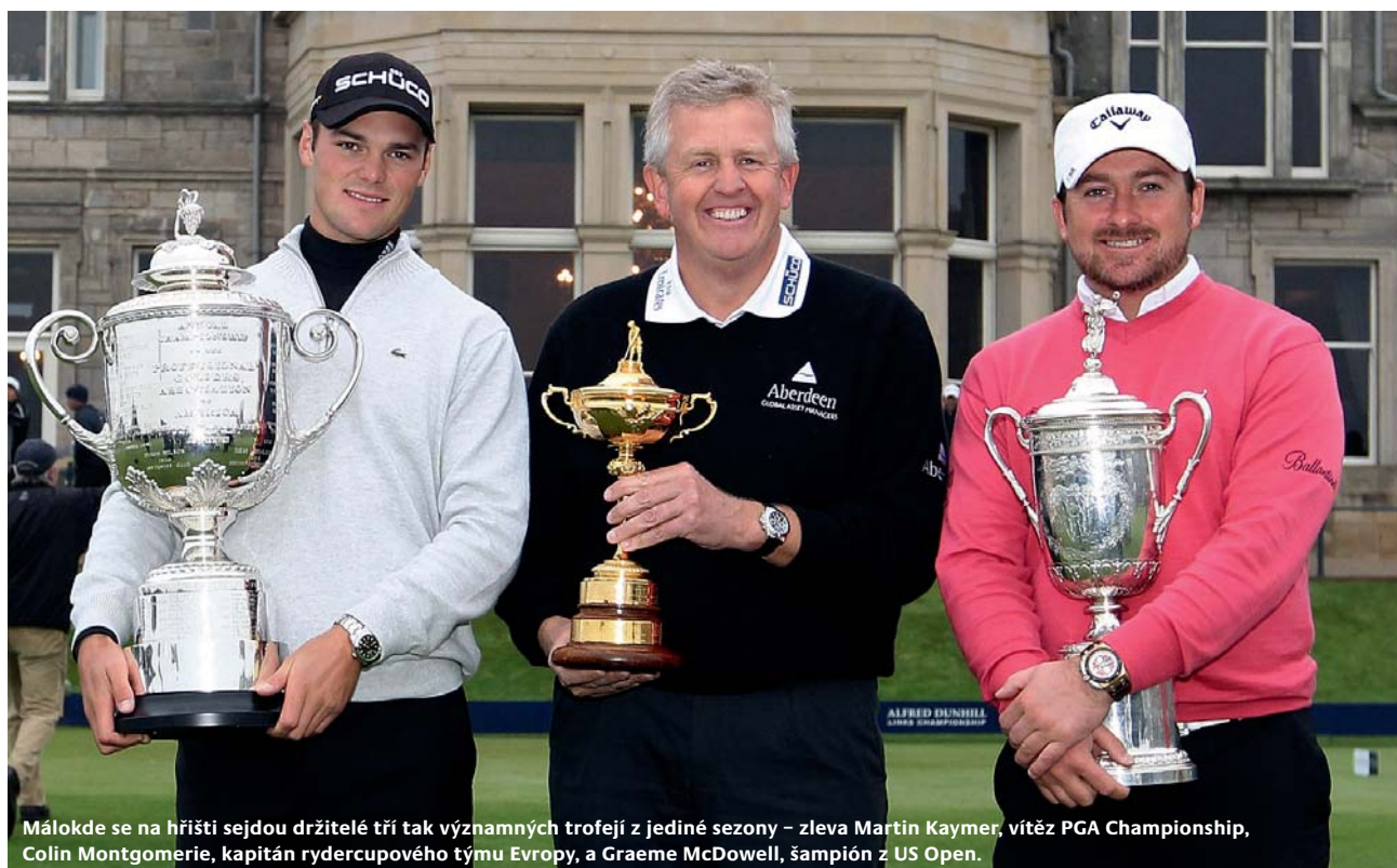
Málokde se na hřišti sejdou držitelé tří tak významných trofejí z jediné sezony – zleva Martin Kaymer, vítěz PGA Championship, Colin Montgomerie, kapitán rydercupového týmu Evropy, a Graeme McDowell, šampión z US Open.

Desátý Alfred Dunhill Links Championship je za námi. Viděli jsme skvělý golf na nejlepších linksech světa, užili si porydercupové euforie a oslavili letošní triumf evropského golfa. Konec konců, co může být lepším důkazem jeho úspěchu než spatřit v St. Andrews najednou trofeje z US Open, US PGA Championship a Ryder Cupu v rukou evropských borců!