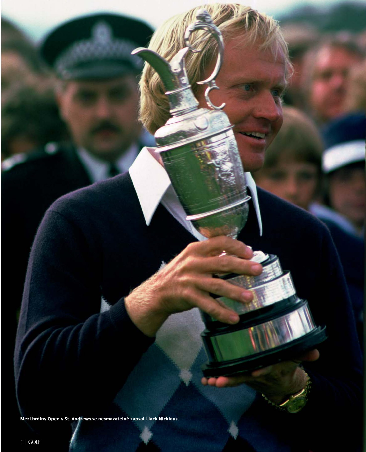
Mezi hrdiny Open v St. Andrews se nesmazatelně zapsal i Jack Nicklaus.