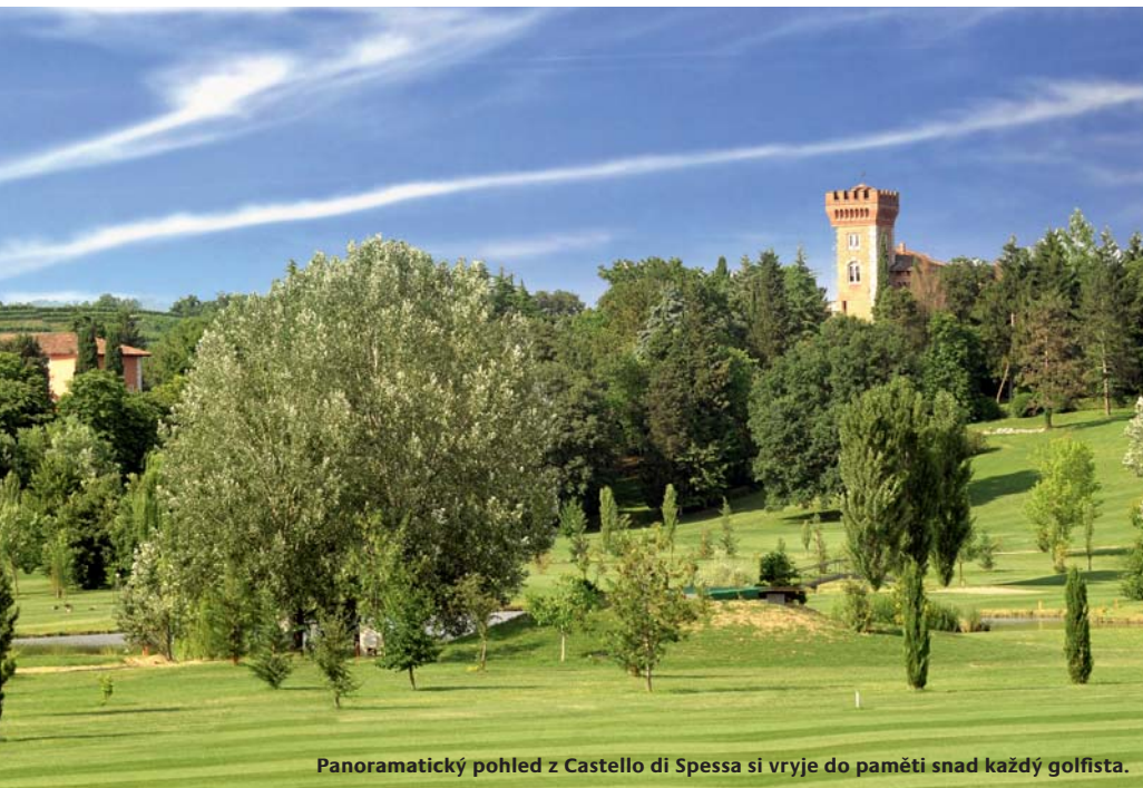
Panoramatický pohled z Castello di Spessa si vryje do paměti snad každý golfista.

Jednotlivé jamky většinou nabízejí dostatek prostoru v přehledném terénu, takže pokud rádi hrajete drajvrem, určitě si zdejší golfový zážitek užijete. Na grínech vás nečekají žádná nepřijemná překvapení a vyznačuje-li se vaše hra dobrou konzistencí, zaručeně si přinesete dobré skóre. V každém případě je ale třeba zbystřit před každou vodní překážkou. Některé jamky (třeba č. 8, 12 a 13) těsně sousedí s břehy jednoho ze dvou jezer, která přitahují míčky jako magnet. Kromě jezer jsou tu také tři potoky, které třeba na dvojce a šestnáctce protínají fervey v samém prostředku, takže zhatí i dobře míněný drajv. Obchodní značkou Lignana jsou rozsáhlé plochy přírodního písčitého rafu nazývané Arizona. Najdete je třeba na jamce č. 9 nebo 15, a pokud se jim