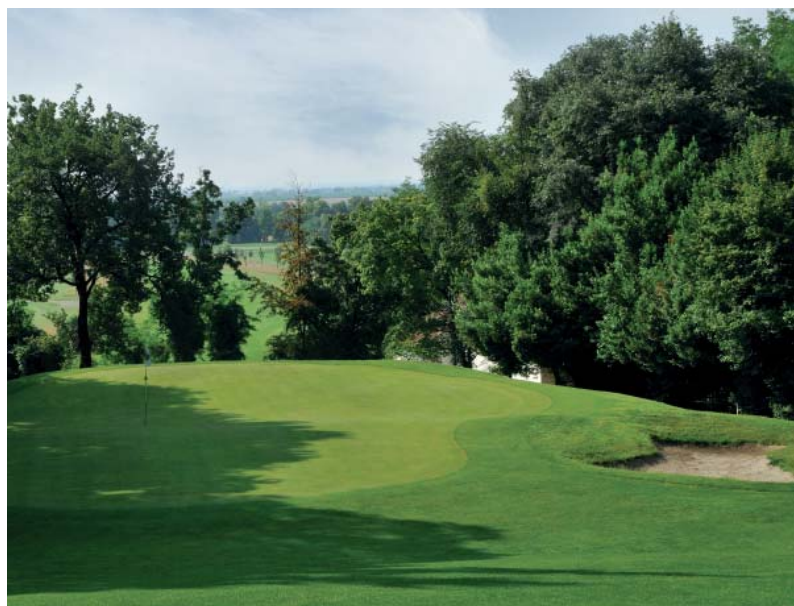
Fervej a grín dvojky na hřišti GC Aviano, nejtěžší jamky zdejší osmnáctky.

odrodní Friulano, Chardonnay a Sauvignon, vyznačující se příznaky zralého tropického ovoce, akátového medu, pomerančů a letních květin.