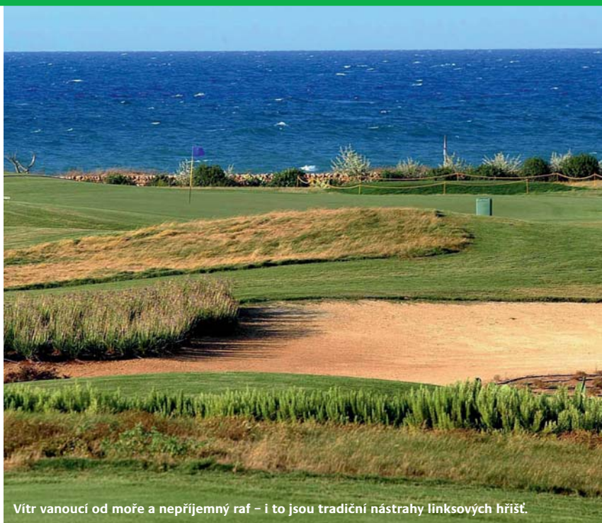
Vítr vanoucí od moře a nepřijemný raf – i to jsou tradiční nástrahy linkových hřišť.

v Itálii si budete užívat golf s do zad příjemně hřejícím sluncem. Vítr nebude vašim jediným protivníkem. Hřiště je bohaté na chytře umístěné bankry, jasně vymezené ferveje a zajímavě tvarované gríny. Připravte se tedy na inteligentní golf s rozmyslem.