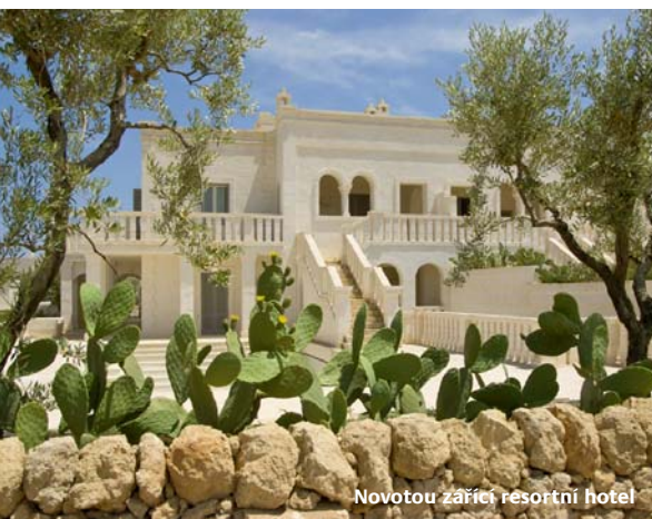
Novotou zářící resortní hotel