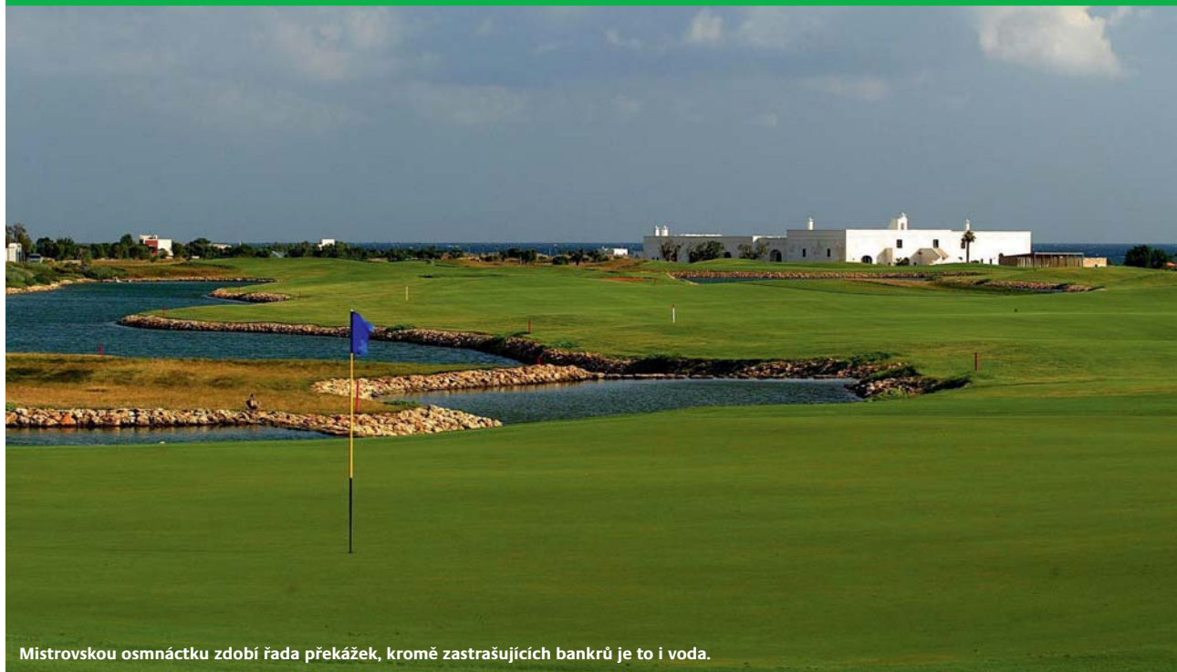
Mistrovskou osmnáctku zdobí řada překážek, kromě zastrašujících bankrů je to i voda.