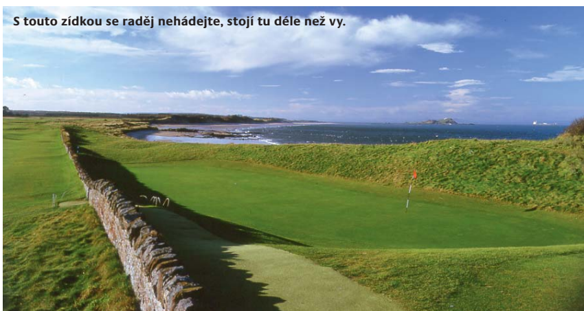
S touto zídrou se raději nehádejte, stojí tu déle než vy.