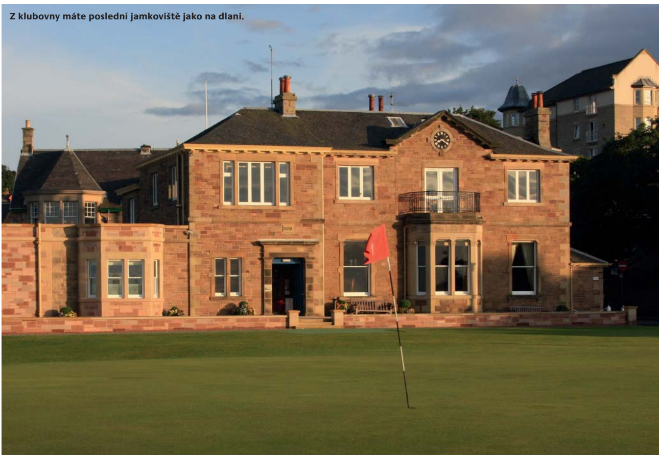
Z klubovny máte poslední jamkoviště jako na dlani.