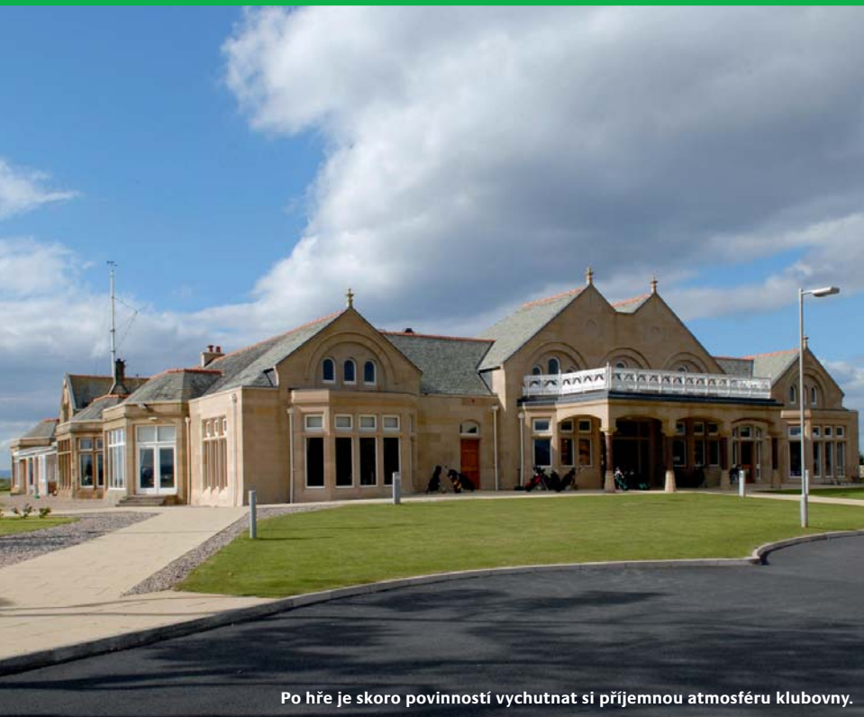
Po hře je skoro povinností vychutnat si příjemnou atmosféru klubovny.

Nejtěžší jamkou na hřišti je jedenáctka. Je to pro profesionály brutální par 4, měřící neuvěřitelných 490 yardů. Jamka se jmenuje Railway (Železnice) podle železniční trati běžící souběžně s celým jejím pravým okrajem. Když svou první ránu namíříte příliš doleva, ztratí se vám zase míček v hustých hlodaších. Ani u druhé rány si neodpočínáte, protože jste stále daleko od grínu, kolem jehož pravého okraje se opět vine již dobře známá trať. Mimochodem v roce 1997 byla jedenáctka vyhodnocena jako nejtěžší jamka Open Championship. Závěrečný sled jamek na Royal Troon je tak náročný, jak by se u mistrovského hřiště dalo očekávat. Šestnáctka je par 5, ale s opravdu dobrou šancí na birdie. Hráči by se této příležitosti rozhodně měli chytit, protože na sedmnácté a osmnácté jamce se jejich naděje na úspěch podstatně snižují. Jamka číslo 17 měří 211 yardů, jde o třípar vyžadující první ránu dlouhým železem či dřevem, abyste dosáhli grínu, který se svažuje směrem od jamky, a to po všech stranách. Až do Open Championship v roce 1989 byla závěrečná jamka na hřišti Royal Troon vnímána jako poměrně nesmělý finiš pro elitu profesionálního golfu. To vedlo k vytvoření mistrovského odpaliště, které dalo jamce potřebnou délku