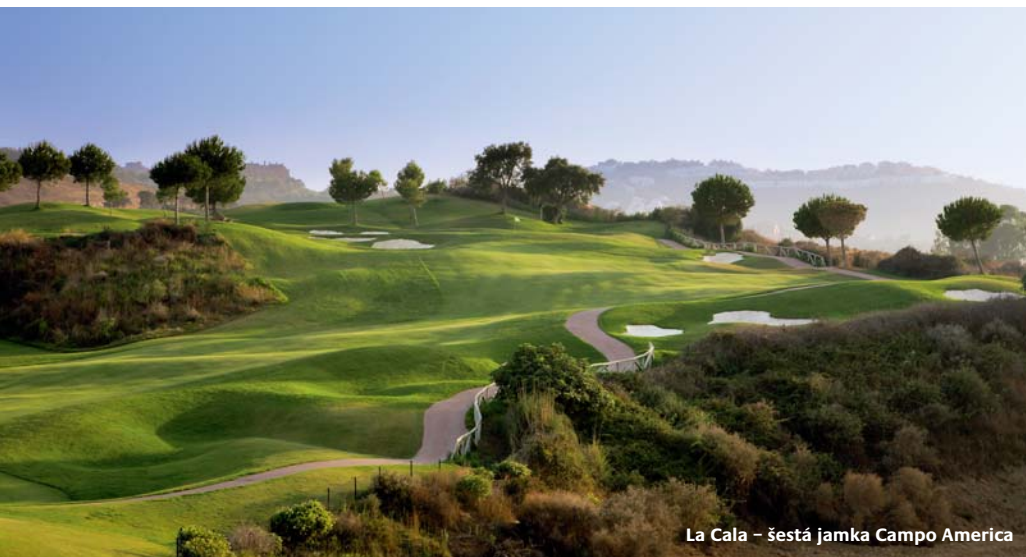
La Cala – šestá jamka Campo America

Obecně se dá španělský zážitek shrnout slovy – velice příjemný. Pokud máte rádi dovolenou ve stylu resortů poskytujících veškerý komfort, zázemí a golf, pak je uvedená konstelace přímo ideální. Záruka dobrého počasí a přijatelné ceny za vysoký standard služeb jen umocňují celkově atraktivní nabídku. ■