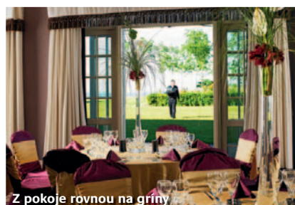
Z pokoje rovnou na griny

samotné a přírodní scenérii, ale také mimořádně klidným prostředím. Dá se tedy doporučit všem, kteří chtějí uniknout z rušného světa velkých měst do skutečné oázy klidu.