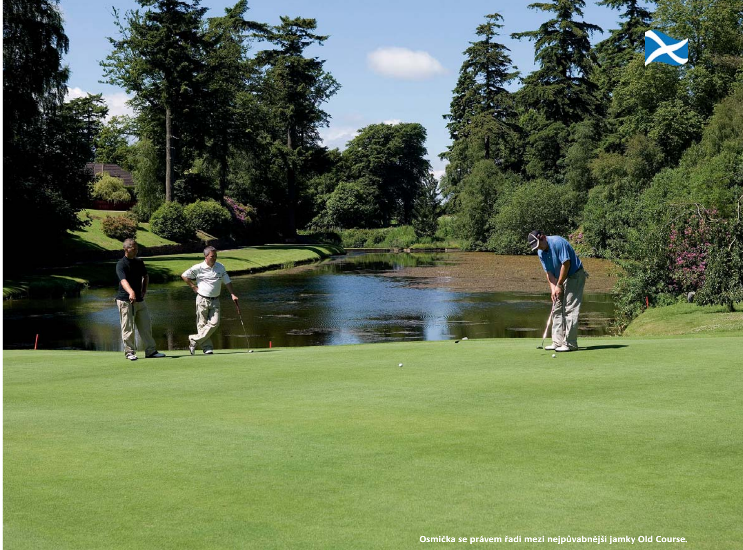
Osmička se právem řadí mezi nejpůvabnější jamky Old Course.

se stylovým dekorem a výhledem na první odpaliště staršího ze dvou hřišť. Hosté zde mohou ochutnat tradiční skotské speciality připravené z místních ingrediencí.