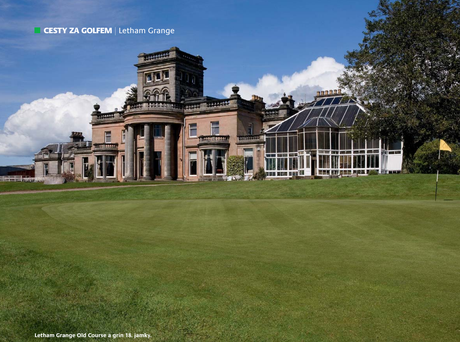
Letham Grange Old Course a grín 18. jamky.