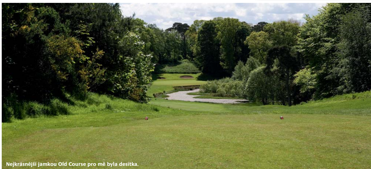
Nejkrásnější jamkou Old Course pro mě byla desítka.

Délka (yardy): 5 276 (žlutá) | 5 528 (bílá) | 4 687 (dámská)