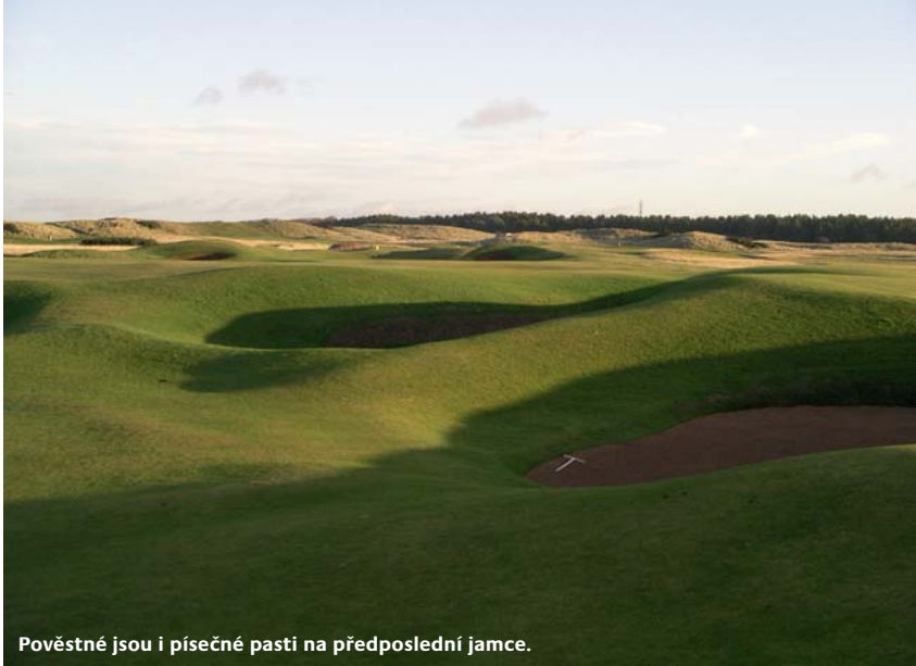
Pověstné jsou i písečné pasti na předposlední jamce.

jenž je podepsán pod řadou citlivých změn v období do první světové války. Dalších 50 akrů pozemku na severním konci hřiště přibýlo v roce 1923. Po konzultaci se známým golfovým architektem té doby Harrym Coltem vzniklo hřiště v podobě, v jaké jej známe dnes. Colt navrhl čtrnáct nových jamek a jeho design byl postaven na dvou smyčkách po devíti jamkách, kdy jedna se hraje těsně vedle druhé, ale v opačném směru. Po této poslední zásadní změně se hřiště postavilo naroveň nejlepším kolbištím světa.